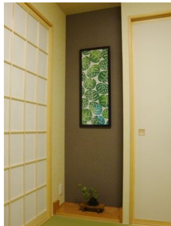
さっそくつらえられた床の間が素敵です