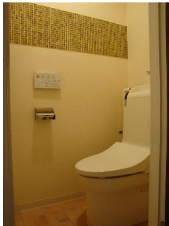
タイルにこだわったトイレは南仏風

1階で庭があり、ペットが飼えること。新耐震基準後の建築であること等の譲れない条件を決めて探しましたが、中々見つからず、1年半ほどかけてやっと出会えたという感じです。リフォームの規模と、物件自体の金額のバランスが難しかったのもありますね。今思うと、物件が見つかるのは「縁」だなと感じています。これから探す方も、いらっしやると思いますが、焦らずに、疲れたら休むくらいの気持ちで、気楽に探して頂いた方が良いでしょうと、アドバイスしたいです。