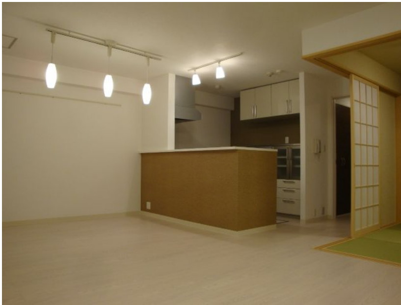
マンションの1階ということもあり実現した対面キッチン。変化をつけた壁紙がアクセントに。