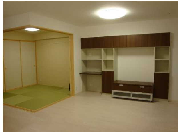
日中は障子を開けて開放的に。システム収納にはご主人の書斎スペースが