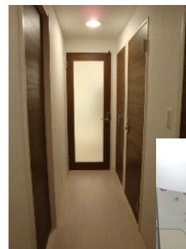
光の抜けるリビングドアで廊下も明るく

和室が気に入っています。寝室に使っているのですが、障子で仕切られている感じが、旅館に泊まりに来ているような雰囲気が良いです。あとはキッチンが対面にできたので、部屋が見渡せること。カウンター部分と床の間の壁紙に変化をつけたのも良かったです。お風呂も気に入っています。浴槽の中に、腕が置けるアームレストが付いているのですが、それがとても快適です。