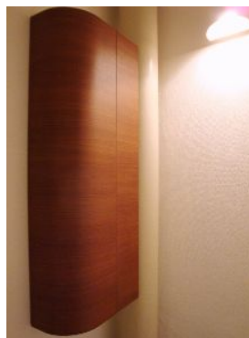
Rのラインが綺麗なトイレの収納