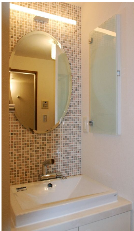
オリジナルの洗面台は、シャビーなモザイクタイルを使って、可愛らしさと、素朴さと、クールさが一体になった空間に。