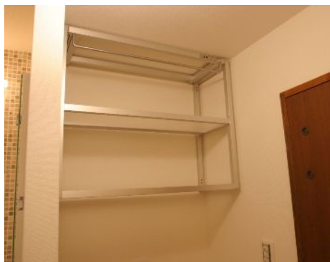
洗濯機上のスペースにつけた物干し付きの棚