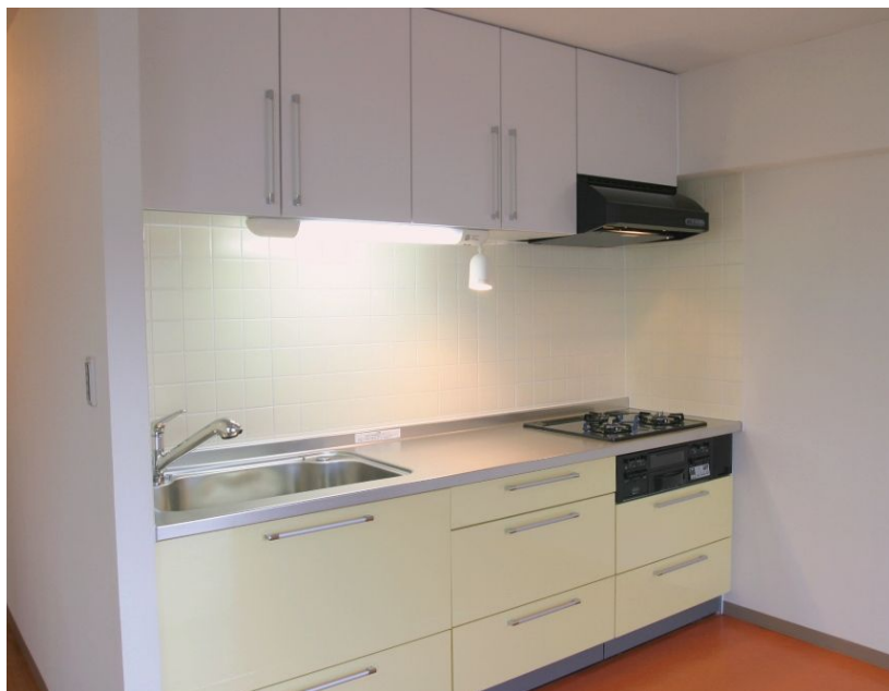
ホワイト色の吊戸棚は、お部屋を明るく広く見せてくれます。照明はスポットライト付きで便利。

「これはっ！」と一気にイメージが広がりました。ホームページを拝見した時のことです。転勤で札幌に戻り、リフレッシュしての新生活のためマンションリフォーム…。他社のリビングの施工例の掲載を眺めていても今ひとつピンとこない中、目に飛び込んで来たのが、タイルの洗面所。「これを造った方々に相談してみたい。」と思ったのがきっかけです。