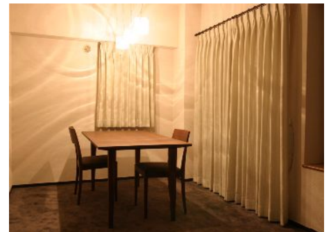
珪藻土を塗ったぬくもりのある空間に電球の温かな光がこぼれます。あわせて、やわらかい素材のカーテンとダイニングテーブルも新調しました

当初よりお願いしていたガラスブロックと珪藻土が、実際に出来上がってとても気に入っています。また、洗面所は既製のものにはしたくありませんでした。相談したところ、タイルを使ったオリジナルの洗面台を提案され、素敵なモザイクのタイルを見て、「これを使いたい!」と思いました。そこにガラスのモザイクタイルを薦めてもらったのですが、その調和が面白く、お気に入りの空間になっています。